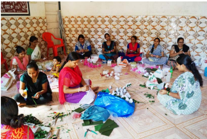
flores de tela de Sant Jordi

Como cada año, mujeres de las zonas más desfavorecidas de Bombay con las que trabaja la Fundación, han elaborado de forma artesanal rosas de tela que se venderán en Sant Jordi en varios stands de Barcelona (Rambla Catalunya y Passeig de Gràcia), Sabadell, Tarragona, Cervelló e Ibiza (Sant Jordi Ses Salines). El objetivo es recaudar fondos para la iniciativa GIRL , destinada a impulsar proyectos especialmente orientados a que las niñas y jóvenes de estas zonas de Bombay puedan estudiar y conocer sus derechos.