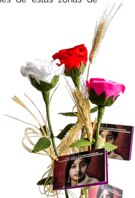
Mujeres elaborando flores y las