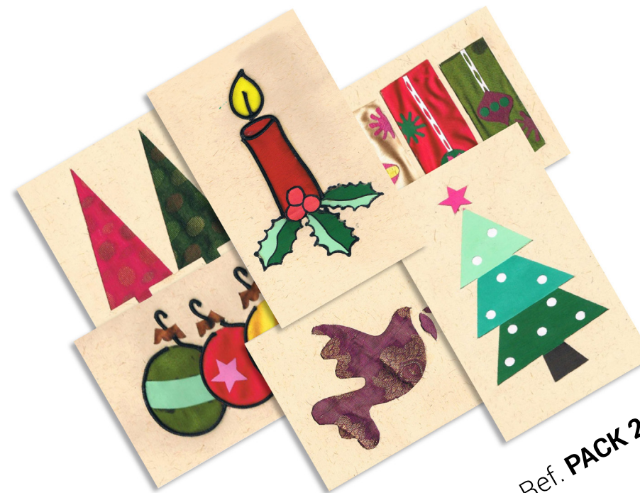
Ref. PACK 2013