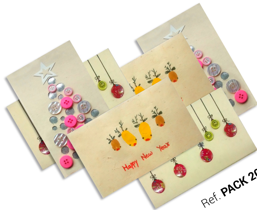
Ref. PACK 2014