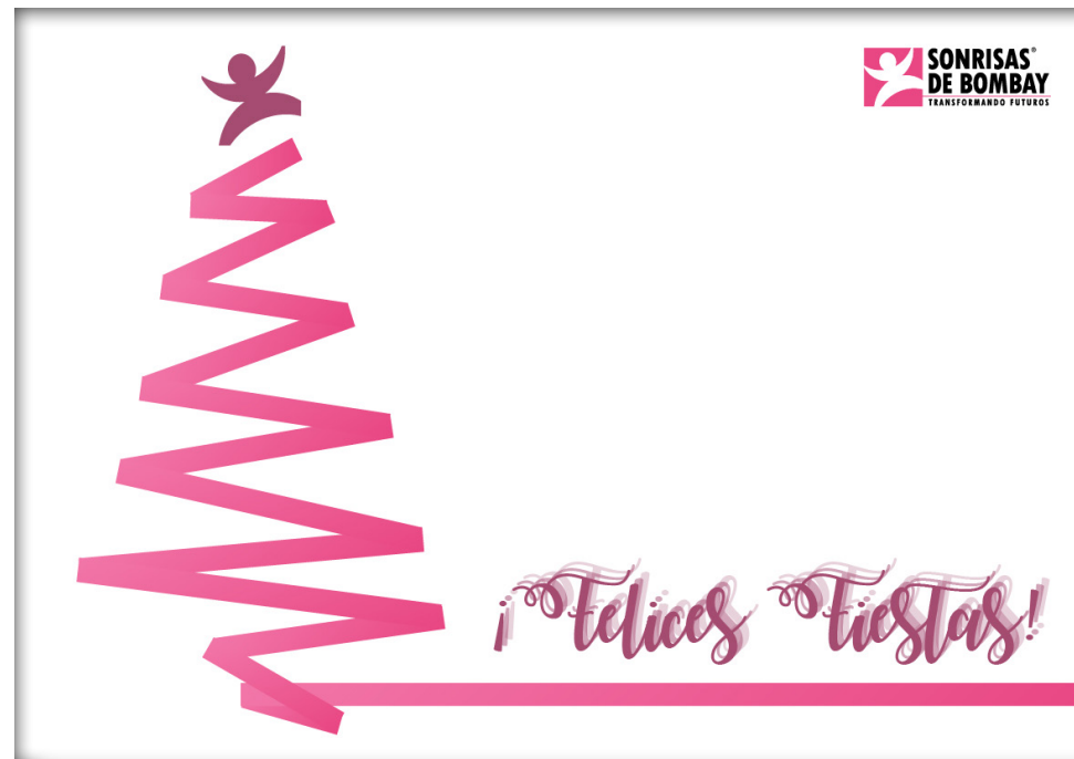
Ref. DIGI ARBOL