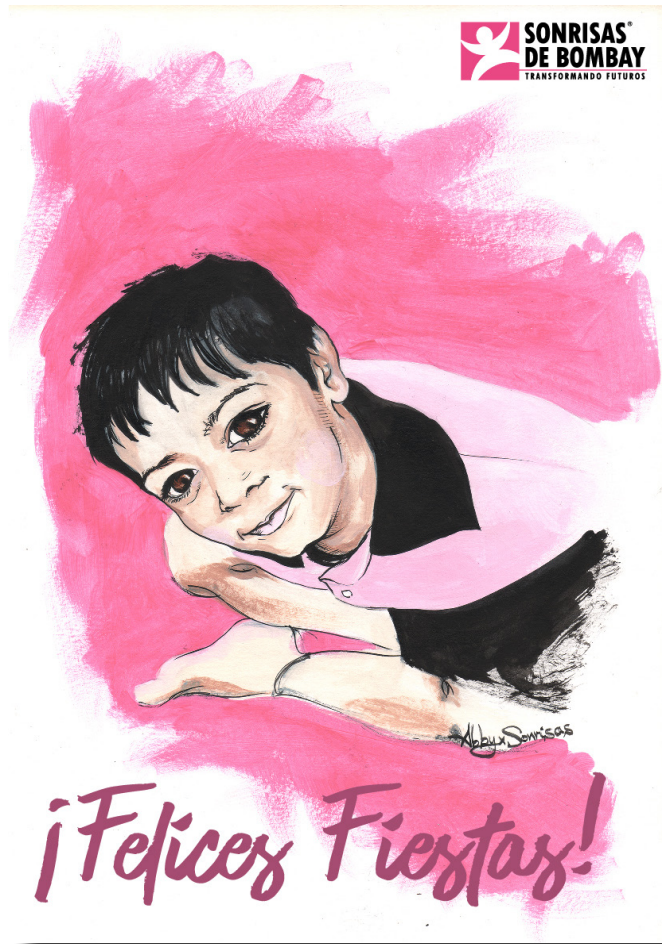
Ref. DIGI NIÑO