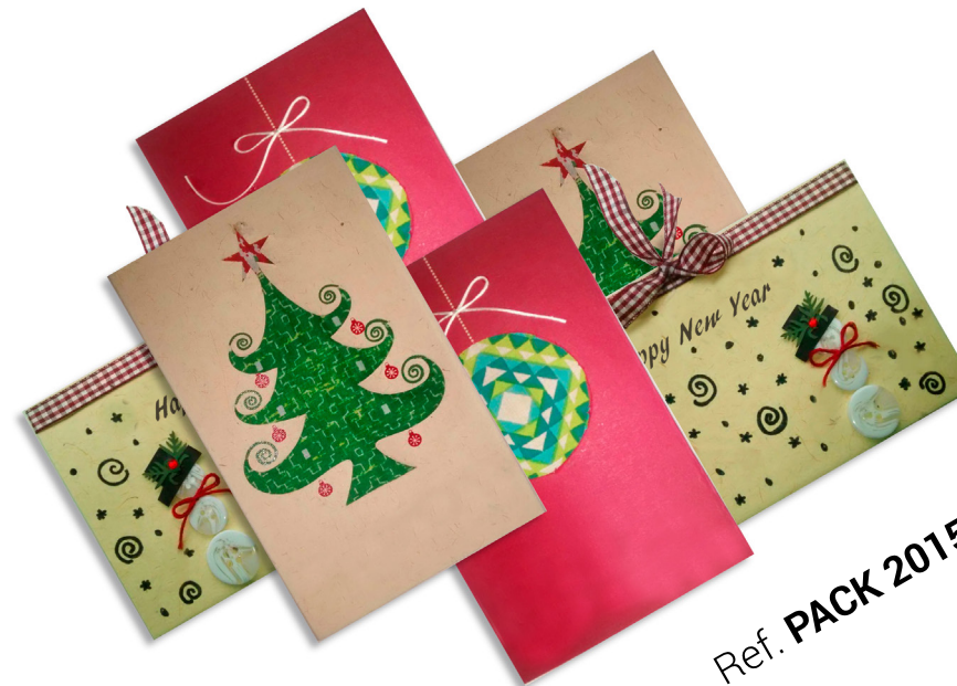
Ref. PACK 2015