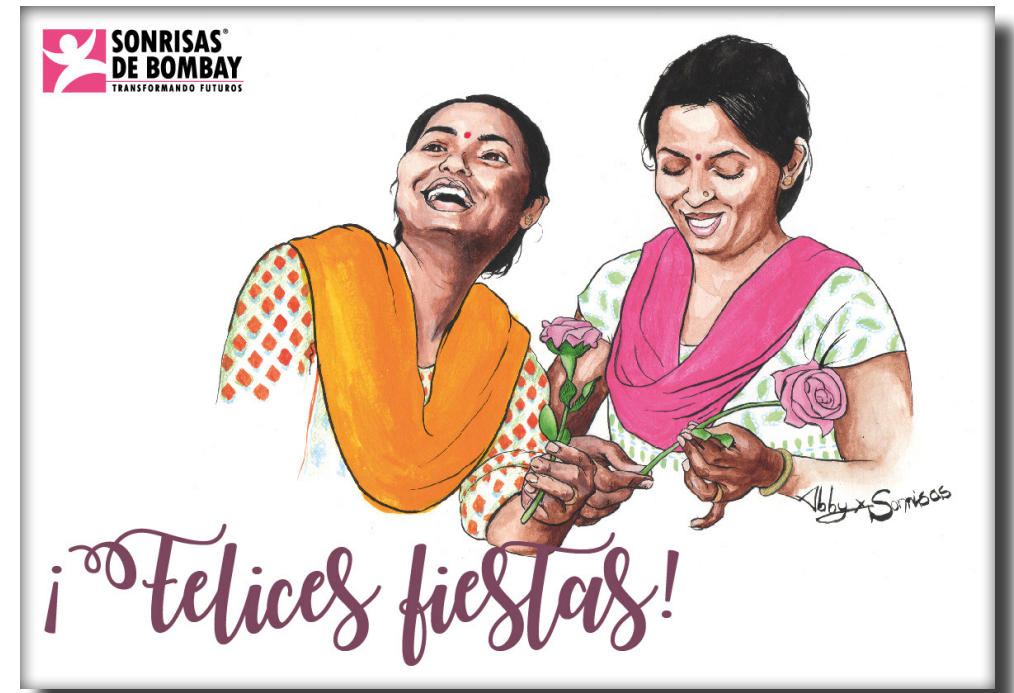
Ref. DIGI MUJERES