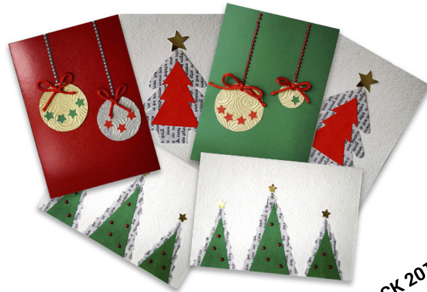
Ref. PACK 2017