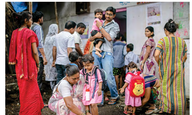
Hora de la salida en uno de los parvularios que impulsamos en Bombay

De este modo, la India se ha puesto al mismo nivel que el resto de los 134 países del concierto de las Naciones Unidas que han convertido en un derecho fundamental la educación para todos los niños y niñas del país.