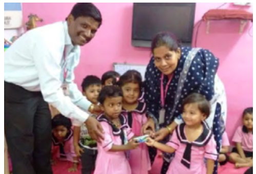
Celebración del Día del Profesor

En definitiva, este avance en el cumplimiento del respeto al derecho a la educación que se traduce en la mejora real de muchas vidas, es posible sólo gracias al apoyo de socias y socios colaboradores, donantes y empresas colaboradoras que con su implicación contribuyen a la consolidación y mejora de los proyectos que impulsamos conjuntamente con las comunidades de los slums en los que trabajamos para plantar cara a la pobreza. 🚩