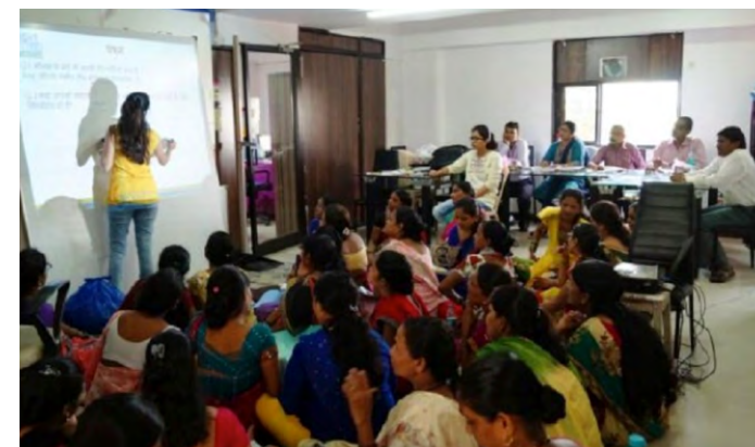
Formación sobre control nutritivo del alumnado